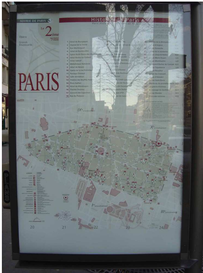
Figura 2. Panel de cartelera, Boulevard Bonne Nouvelle, Paris. El mapa representa el segundo distrito de la capital. Un punto rojo en la parte superior derecha en el límite del distrito, localiza la posición del panel.

Sin embargo, la mayoría de los mapas, que se venden o distribuyen al público en general, no se enfocan en las áreas sino las vías, pues se trata de planos de orientación destinados a guiar al usuario en el traslado de un punto a otro, a través de la red de calles o líneas de transporte. A menudo, esta segunda forma de representar el espacio minimiza la cartografía de los límites e insiste en la cartografía de conexiones. Esto lleva a plantear la cuestión sobre la oposición entre la red y el territorio. Cuando el usuario toma la red, ¿cruza el territorio como si estuviera en un túnel o lo está produciendo?