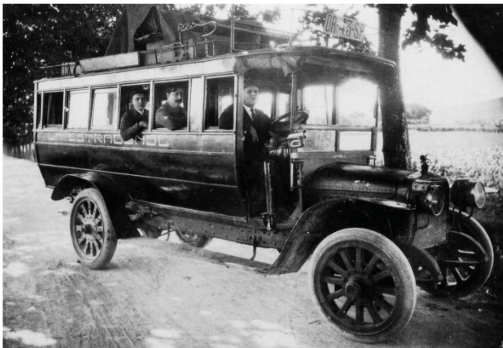
A Estrada Autobus de «La Estradense», a comienzos del siglo XX

La Estrada era además una villa bien comunicada con las diferentes localidades del entorno, tenía comunicación diaria por autobús 23 con Pontevedra, Lalín, Santiago, Forcarey y Portas. Este hecho facilitará la comunicación con las villas costeras y así el tráfico tanto de personas como de mercancías, permitiendo una fluidez informativa en lo referente a las noticias, entre ellas las de la emigración, y de las oportunidades de trabajo y prosperidad existentes al otro lado del Atlántico, factor que marcará irremediamente el destino de este pueblo y de sus gentes, al igual que el de muchos otros paisanos.