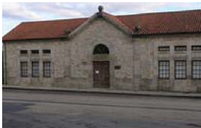
Antiguo edificio del Matadero Municipal

El 17 de Mayo de 1872, se finalizan las obras de construcción del matadero, actualmente restaurado y sede del Museo Reimóndez Portela.