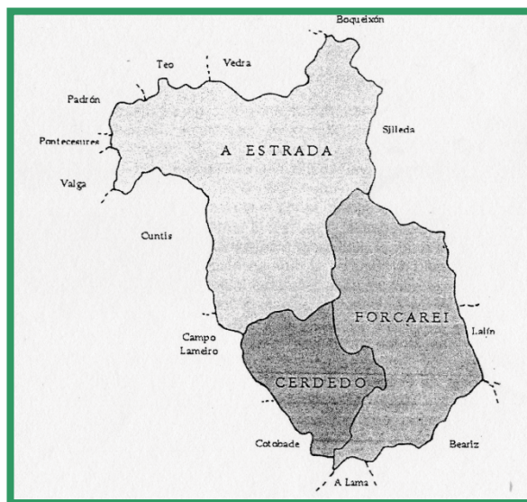
Mapa de Terra de Montes, a la que pertenece el ayuntamiento de La Estrada 2

El territorio comprendido actualmente dentro del ayuntamiento o distrito de La Estrada, pertenecía anteriormente a las jurisdicciones y cotos de; Tabeirós, Vea, Codeseda, Viso y Vega, y Oca 1 . Hecho por el cual a continuación iniciaremos un breve repaso por la historia de este territorio