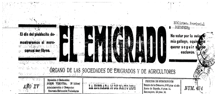
Cabecera de El Emigrado, a 16 de Mayo de 1934

En 1900 comienza a funcionar el alumbrado público en la villa de La Estrada y desde 1906 sus habitantes disponen de prensa propia, con publicaciones como La Voz del Pueblo , El Estradense , el semanario El Eco de la Estrada , (publicado entre 1912 y 1919), La Palanca , El Eco Estradense y La Vanguardia , además de El Emigrado 19 , semanario de carácter independiente que por dificultades oficiales deja de publicarse en 1940.