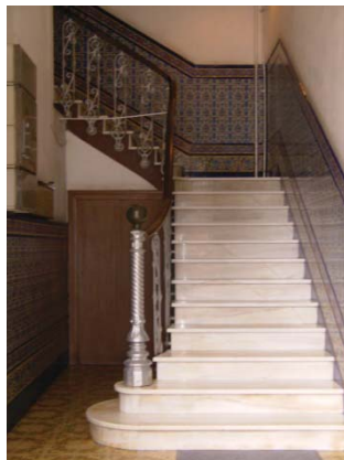
Entrada del antiguo Centro de Emigrados

la primera mitad del siglo XX en la que se realizan construcciones de carácter privado, destinadas fundamentalmente a viviendas, sin olvidar aquellas dedicadas a lugar de reunión, como fue el caso del centro de emigrados.