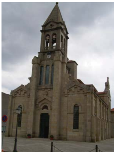
Iglesia nueva de La Estrada (1859) 22

Para atender las necesidades de ocio de los residentes de la villa y alrededores, se había creado un espacio donde hacer representaciones teatrales y actuaciones musicales, y al que se conocía como el salón de novedades .