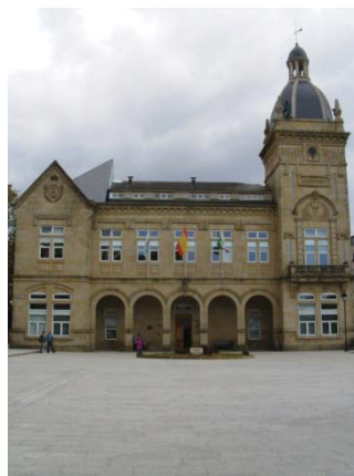
Ayuntamiento de A Estrada

Sus edificios públicos no son tan numerosos como los servicios que en ellos se recogen, cuenta La Estrada con la Casa Consistorial, de nueva construcción, subvencionada por los emigrantes, en la que se encuentran además de las oficinas municipales, los Juzgados Instructor y Municipal, el Registro de la Propiedad, el Archivo Notarial y el Laboratorio.