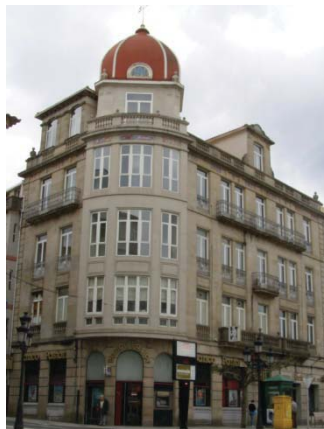
La Casa del Escobero en la actualidad

De este momento es la conocida como «Casa del Escobero», situada en la Plaza principal y que se conoce con este nombre porque su promotor era dueño de una fábrica de escobas en Cuba.