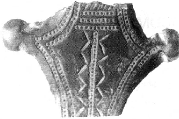
Fig. 2 - Détail du décor sur l'agrafe de Florensac.

3). Les agrafes de ce type se rencontrent essentiellement, de part et d'autre des Pyrénées, au Nord-Est de l'Espagne et en Languedoc. Elles sont rares en dehors de ces régions, ne se trouvant que très sporadiquement au-delà de l'Ebre et sur la façade atlantique. Une agrafe de ce modèle a néanmoins été signalée en Forêt Noire, dans le tumulus du Magdalenenberg (4) (fig. 3).