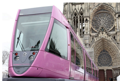
Tramway de Reims,

À regarder passer les tramways dans les rues des villes de France, on est souvent saisi par leur esthétique. En particulier, leur face avant semble déployer une figure totémique de la Ville censé probablement la protéger dans son avancée vers la modernité. Les références anciennes, quasi intemporelles, sont actualisées dans le tramway et parcourent la ville pour annoncer cette nouvelle ère.