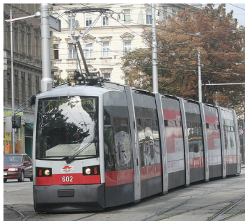
Tramway de Wien,

Cette « french touch » s'accompagne corrélativement d'une forme de mépris pour ceux qui n'ont pas eu à réinventer le tramway. Le directeur du design d'Alstom juge ainsi les autres tramways : « Les Allemands, eux, avaient gardé leurs tramways. Ils ont continué avec des boîtes de conserve » (X. Allard).