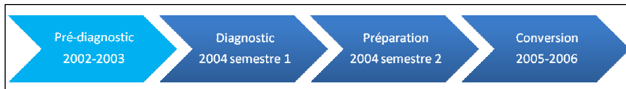
Figure 2 : Les phases du projet de conversion

Nos terrains de recherche nous conduisent à discerner plusieurs phases successives représentées par la figure 2 et détaillées ci-après.