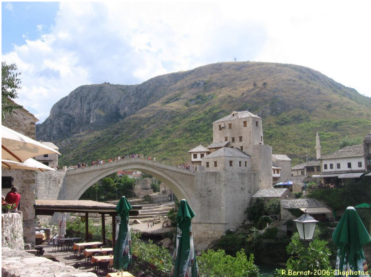
Figure n°1 : Le « nouveau Vieux pont » de Mostar