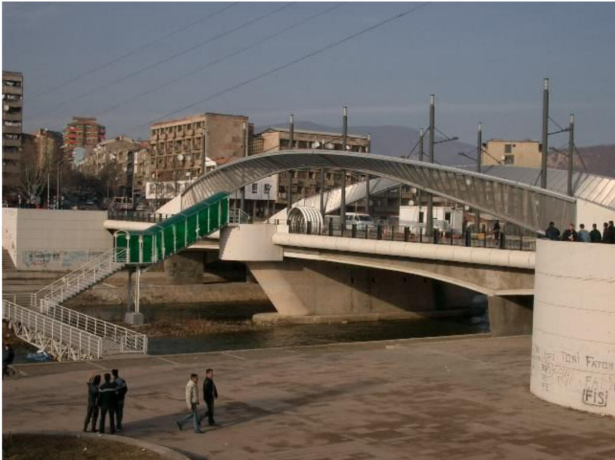
Figure n°2 : Le pont Ouest de Mitrovica