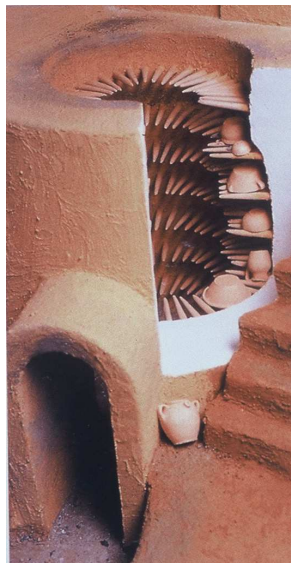
Fig. 3 : Restitution d'un four à barres. Maquette de Pierre Vallauri. Avec l'aimable autorisation de l'artiste ( Le Vert et le Brun , Marseille 1995, p. 36).

Les fours de potiers construits à Byzance sont du type dit à flammes nues; de plan circulaire, un fort pilier central ou plusieurs petits piliers supportent la chambre de cuisson et soutiennent la sole percée d'un nombre variable de trous. La forme extérieure du four correspond à un dôme avec une ouverture au sommet qui assure le tirage du foyer 17 . Or des barres d'enfournement en terre cuite ont été trouvées à Serres en Macédoine 18 ; elles indiquent qu'un autre type de four est alors en usage dans le monde byzantin à la fin du XIII e -début XIV e siècle. Il s'agit cette fois d'un four équipé d'étagères faites de barres d'argile enfoncées dans la paroi qui soutiennent les vases à cuire (Fig. 3). Ce four est caractéristique du monde islamique 19 . Aussi sa présence en Grèce du Nord est d'autant plus surprenante que la céramique réalisée dans cet atelier est une production de tradition byzantine.