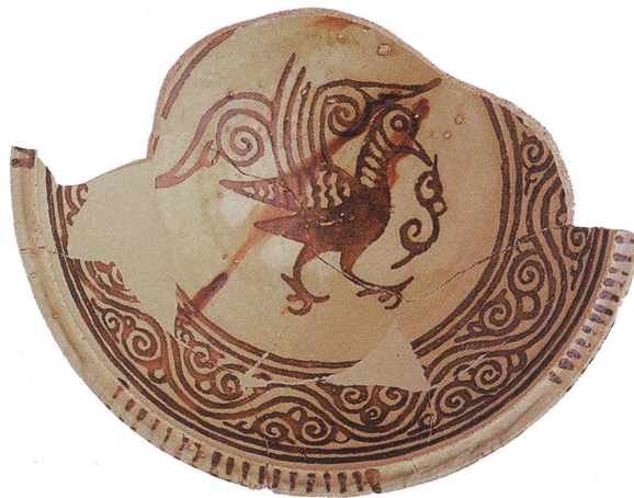
Fig. 5 : Coupe corinthienne peinte à l'engobe rouge d'après D. Papanikola-Bakirtzis, Byzantine Glazed Ceramics: the Art of Sgraffito , Athènes, The Archaeological Receipts Fund, 1999, p. 160)

Cependant l'artisan byzantin ignore tout des moyens techniques mis en oeuvre pour une telle réalisation. L'émail et le lustre lui sont inconnus, aussi recourt-il à d'autres moyens pour s'approcher au plus près de l'effet souhaité, c'est-à-dire un engobe blanc couvert d'une glaçure plombifère incolore pour simuler l'émail et un engobe teinté de rouge pour rendre le lustre (fig. 5).