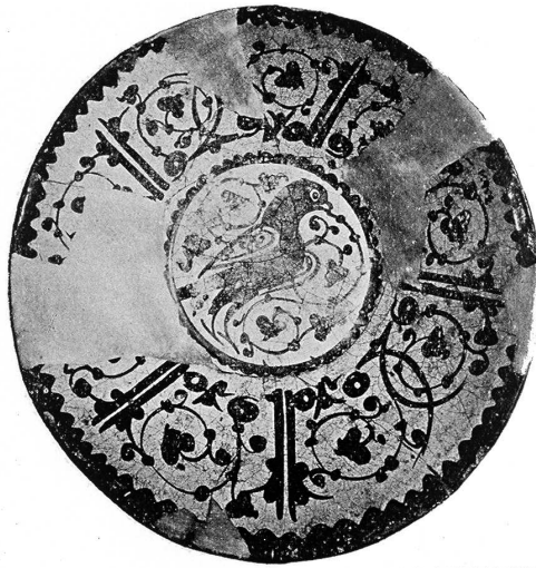
Fig. 4 : Coupe fatimide peinte au lustre métallique, Musée d' Art islamique, Le Caire,

vase corinthien qu'il serait tentant de considérer comme la copie d'une coupe fatimide égyptienne tant les ressemblances entre les deux sont criantes (Fig. 4).