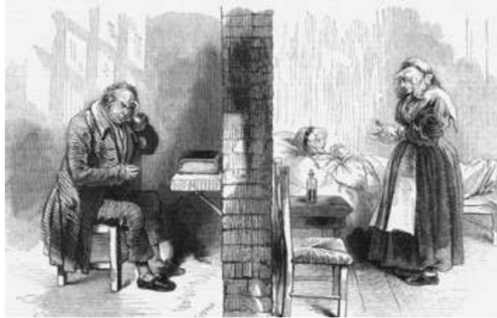
The 'Poor Law divorce', 1846. When people entered the workhouse, married couples were forced to live and work separately.