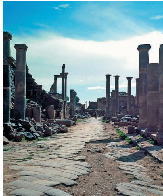
La rue nord-sud entre le nymphée et la mosquée d'Omar : vue vers le sud.

La chaussée a gardé son pavement de basalte à joints obliques qui a été utilisé jusqu'à l'époque médiévale. La chaussée est limitée par des trottoirs, encore visibles sur la majeure partie du trajet et d'une hauteur équivalente à une petite marche. Le