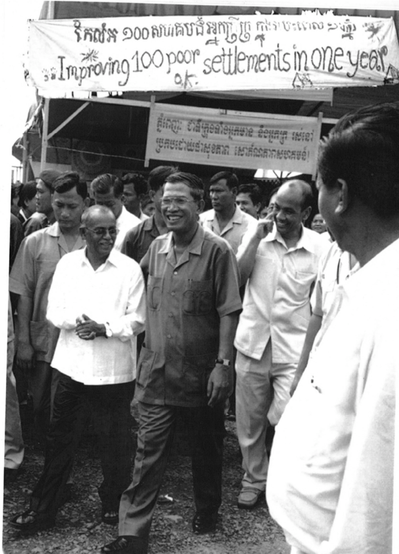
Photo 2 : Lors de la cérémonie de mai 2003, le Premier ministre Hun Sen, entre le Gouverneur de Phnom Penh, Kep Chuk Tema, à sa gauche, et le Président de Slum Dweller International (SDI) et membre de ACHR, M. Jockin Arputham, à sa droite.

4 - Source : brochures et sites web des organisations concernées.