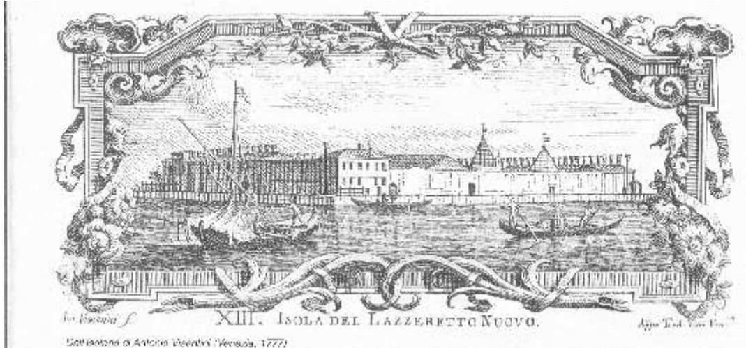
Antonio Visentini, L'isolario veneto , 1777.

1468, le Sénat vénitien décide la constitution d'un second lieu, sur un îlot cultivé de vignes au nord-est de Venise 21 , qui devient le lazzaretto nuovo , réservé aux voyageurs suspects en quarantaine et aux convalescents revenants du lazzaretto vecchio . Lors de la terrible épidémie de 1576 qui fauche un quart de la population vénitienne, cette seconde île de la peste s'agrandit d'un village flottant car, pour répondre à l'urgence, on arrime autour de l'île de très nombreuses embarcations sur lesquelles on a monté des cabanes en planches.