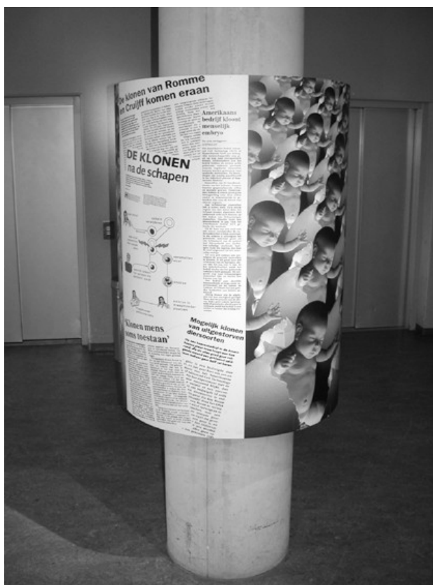
Figure 3 : un « vrac d'images » médiatiques autour d'une colonne, au NEMO

Ces figures du discours à propos de science, qu'on retrouve associées à d'autres thèmes et dans d'autres contextes (actualité, cinéma, etc.), constituent des citations qui témoignent de la conscience explicite de l'existence d'un champ médiatique, d'une sorte de culture commune des médias. A la télévision 8 comme dans les expositions, ce type d'autoréférence ou de citation, apparaît dans la période contemporaine (les années 1990).