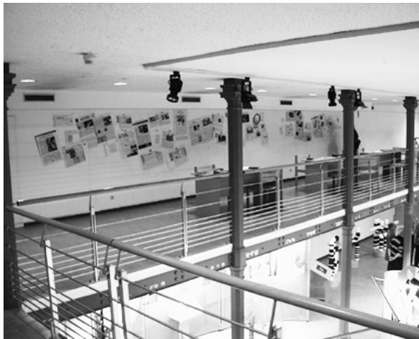
Figure 1 : La mezzanine de l'exposition « Focus on genes »

proprement dite. D'authentiques journaux, très nombreux, tapissent le mur d'entrée, certains passages d'articles ayant été préalablement surlignées. Des magazines, ouvrages et prospectus sont disponibles sur des tables devant lesquelles on peut s'asseoir. Les visiteurs peuvent donc lire des journaux dans un espace qui n'est pas celui de la visite, mais celui d'une pratique documentaire de consultation studieuse.