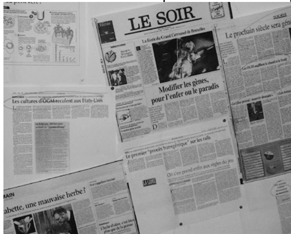
Figure 2 : La revue de presse sur les murs de la mezzanine