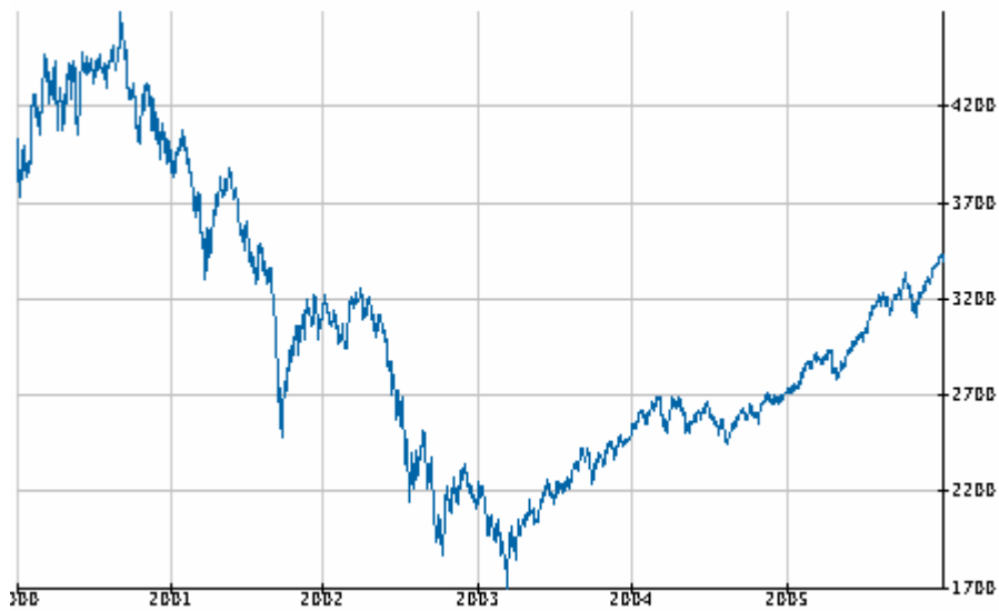
Figure 1 : Evolution de l'indice SBF 120