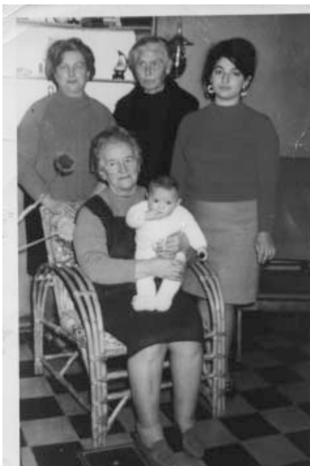
QUATRE GÉNÉRATIONS DANS UNE FAMILLE ARGENTINE (COLLECTION PRIVÉE).