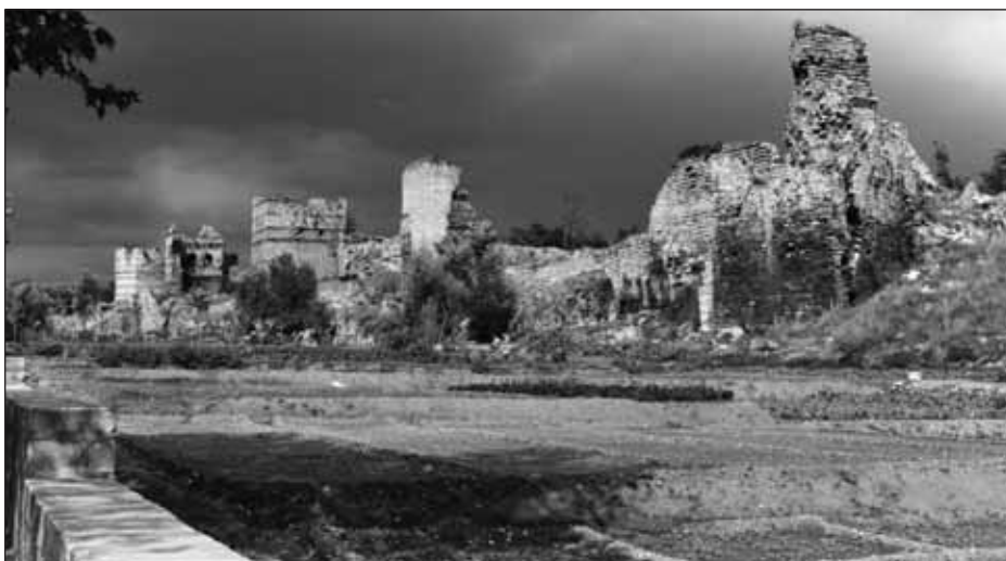
Les tours et le jardin à l'extérieur de la muraille Théodose II (Turquie).

Les visiteurs plus curieux, ou qui disposent de plus de temps, s'approchent pourtant parfois très près de la muraille de Théodose II : la Kariye, ancienne basilique Saint-Sauveur-in-Chora, petit édifice remarquable dont les mosaïques rivalisent avec Sainte-Sophie, n'est située qu'à quelques centaines de mètres d'Edirnekapi et du Tekfur Saray. Ceux qui prennent le temps d'arpenter la Corne d'Or vers Eyüp, en quête du site du pèlerinage voué au compagnon du prophète ou du café Pierre Loti, juché sur le promontoire surplombant l'ancien et immense cimetière musulman arboré, ne font que rarement le détour par le donjon d'Anemas, pourtant tout proche et bien visible. Les plus audacieux, qui iront, à l'opposé, manger du poisson sur les rives de la mer de Marmara et se promener sur les espaces aménagés entre la route et l'eau, pourraient être guidés par les derniers vestiges du rempart maritime pour atteindre les premières tours de la partie terrestre, mais cela s'avère encore plus rare sur cette portion.