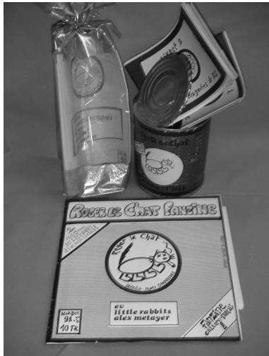
Photo 1. Variabilité du support physique du fanzine Roger le Chat, n° 1 à 3, 1991-1992.

L'importance de la photocopieuse comme outil de reproduction impose tout naturellement un format : A4 ou A5, le A5 étant privilégié par les fanzines punks (possibilité de le mettre dans une poche et de le transporter avec soi). C'est un format de base que le pliage ou le découpage permet de moduler : Inside Susan est découpé de manière circulaire dans une page A4, alors que Supersonic Jazz , Le Stéréophile ou Monotrails & Satellites adoptent le format oblong (A4 plié en deux dans le sens de la hauteur).