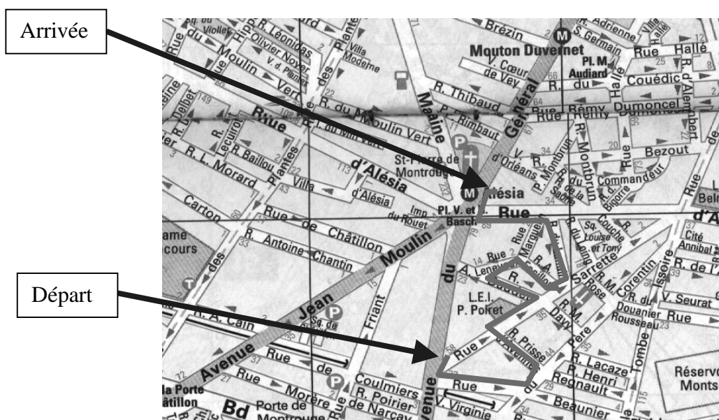
Figure 2 : Itinéraire inconnu d' un non-voyant