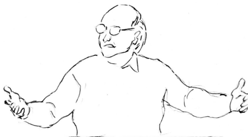
Fig 2 : Tenue gestuelle pendant la pause de 1200 ms (après « c'est un état »)

La longue pause orale qui suit (1200 ms) coïncide de manière très exacte avec une « tenue gestuelle », car le geste de retour est suspendu, aux sens propre et figuré du terme :