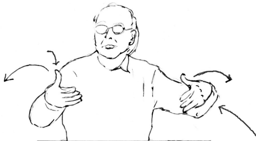
Fig 1 : Geste pendant « c'est un état »

La pause orale qui sépare le préambule « être heureux » du rhème « c'est un état » coïncide avec une tenue gestuelle, qui semble illustrer à la fois la démarcation entre les deux constituants et la solidité du lien logique entre eux. Le rhème « c'est un état » correspond au geste suivant qui se déroule en deux temps : armement du geste (convergence des deux mains), puis ouverture des deux mains, amenant à une position que l'on peut interpréter comme manifestant l'évidence (pour le locuteur) de l'assertion formulée.