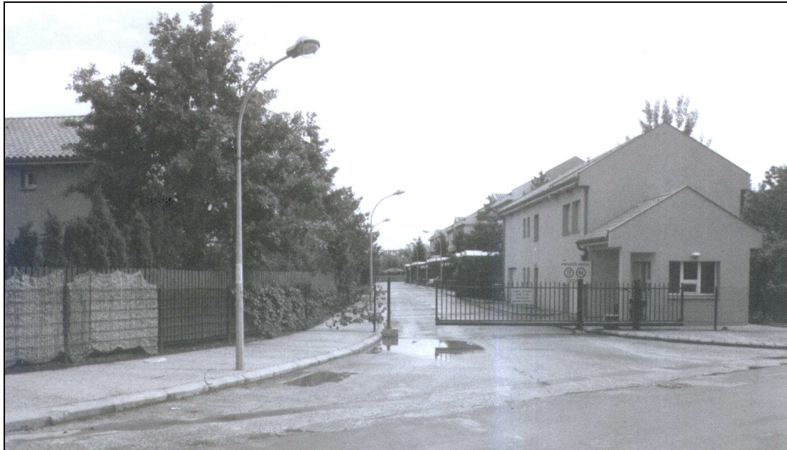
Photo 1 : Entrée clôturée coté Nord du « Village français »

connexion internet haut débit visaient à offrir tout le confort moderne, mais aussi la sécurité et la tranquillité aux étrangers peu familiarisés à Bucarest, et inquiets pour leurs familles.