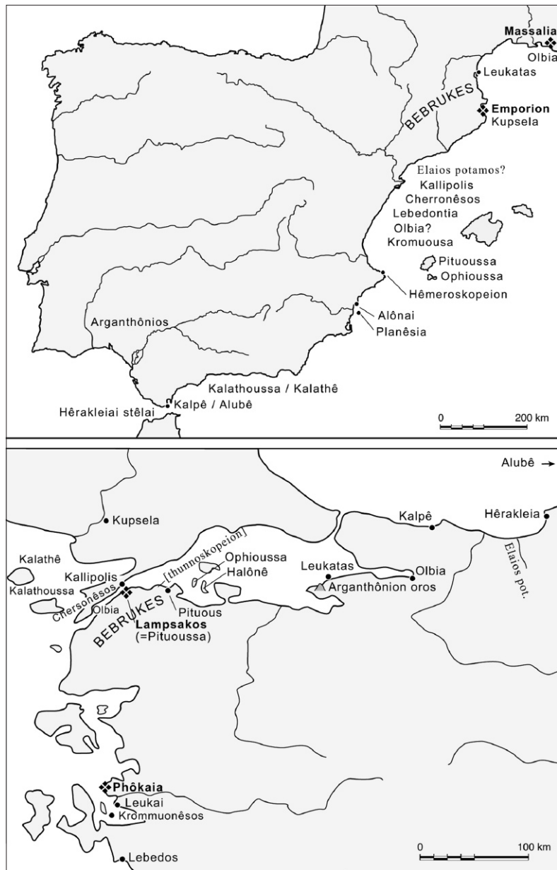
Fig. 2. Localisation des correspondances toponymiques et choronymiques en Ibérie et dans le nord-ouest de l'Asie Mineure (les échelles sont différentes). La localisation d'une bonne part des toponymes ibériques est inconnue, leur placement sur la carte ne doit être considéré que comme une indication approximative