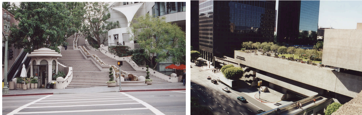
Photos 2 et 3 : Espaces ouverts au public mais privés dans le downtown de Los Angeles (« steps » et « plaza »), un traitement architectural et spatial pour se distinguer de l'espace public environnant

ou de mobiliers qui pourraient attirer des populations indésirables. En fait, la « politique » de gestion de ces espaces est bien dans la sélection de l'utilisateur ; refoulement de populations indésirables (sans-abris, jeunes perturbateurs...) et ciblage des usagers consommateurs des services offerts (payants, comme les restaurants, bars, commerces).