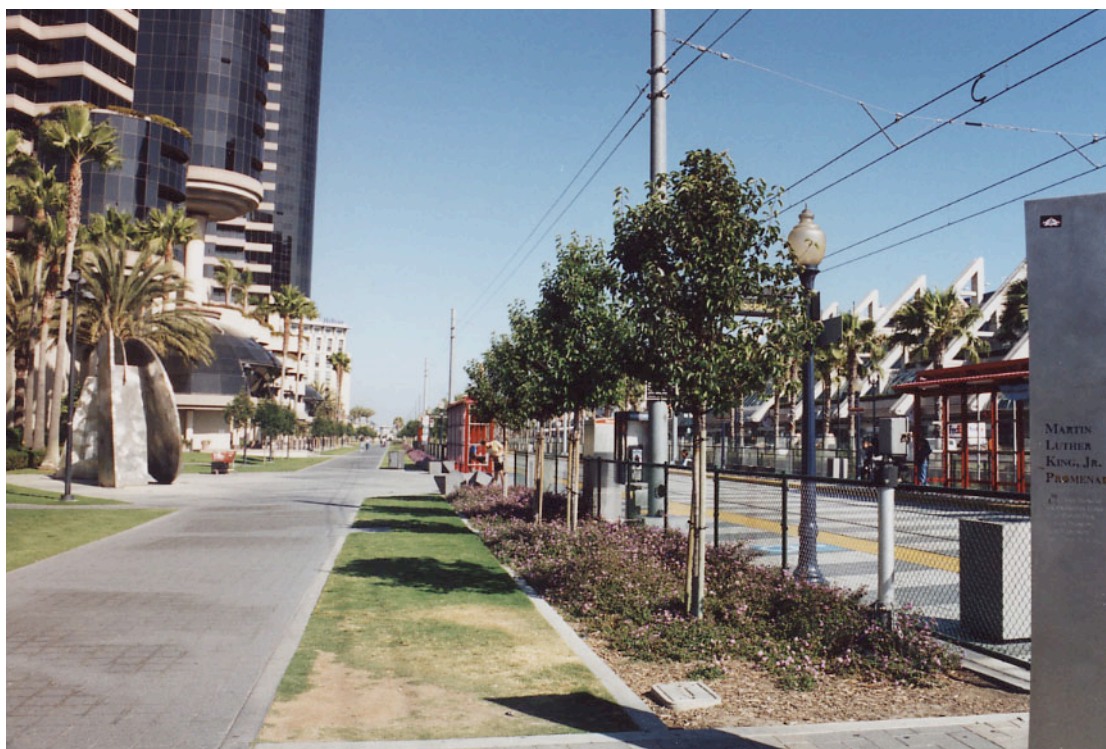
Photo 1 : Espace public du downtown de San Diego, la qualité au service de l'attractivité économique